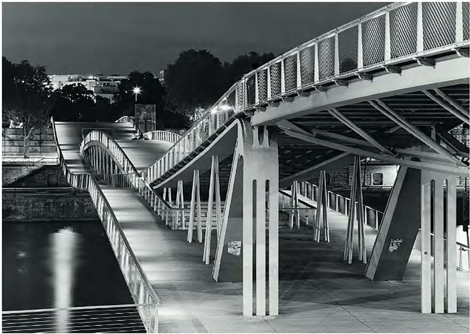
Passerelle Simone de Beauvoir, Les Ponts de Paris la nuit